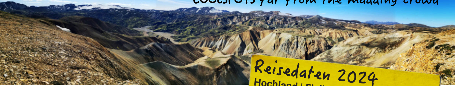
Farbenpracht auf ausgesetzten Pfaden zum Grænihryggur | Landmannalaugar - 2023